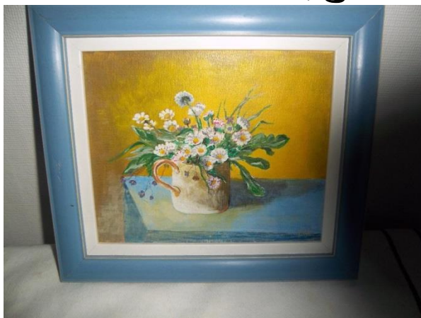
Il a connu « le placard » pour ses engagements, mais à toujours conservé ses idéaux!