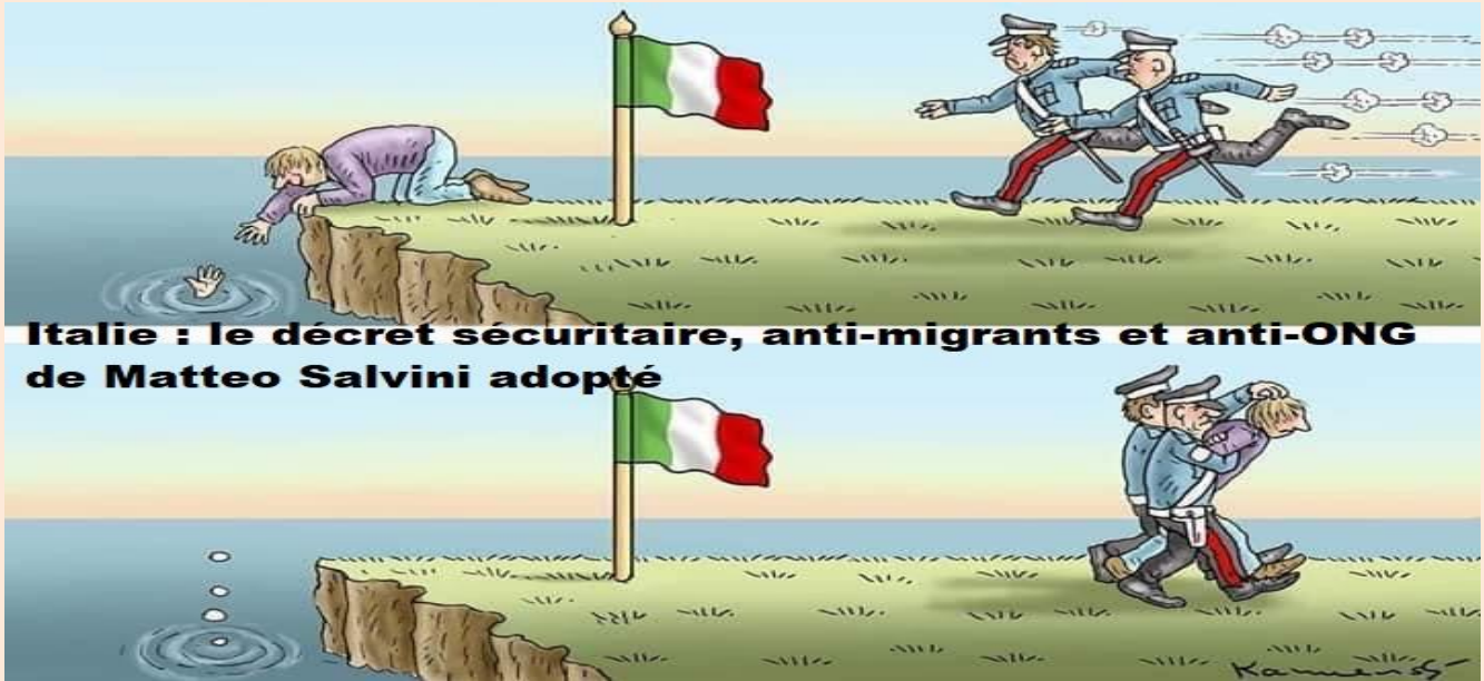
Italie : le décret sécuritaire, anti-migrants et anti-ONG de Matteo Salvini adopté